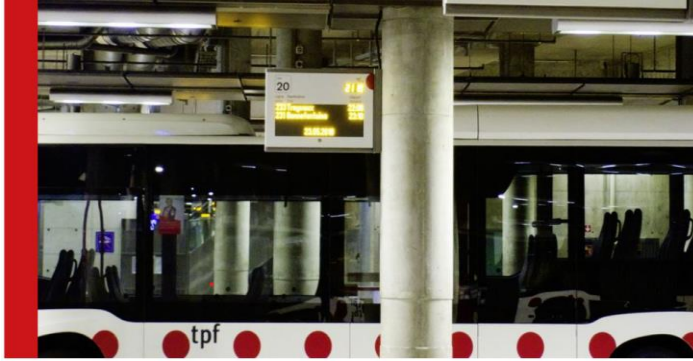
Die Flotte der Freiburger Verkehrsbetriebe (TPF) transportierte vergangenes Jahr über 100'000 Personen am Tag.